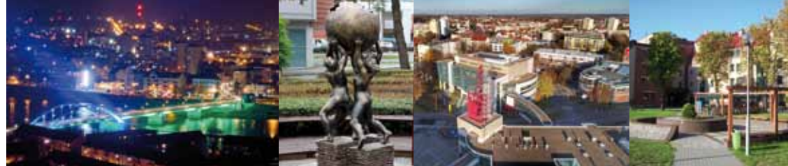
Marzena Słodownik Burmistrz Słubic

Słubice to wyjątkowe miejsce na polsko-niemieckiej granicy, malowniczo położone na brzegu Odry. Miasto leży na terenie woj. lubuskiego, na styku ważnych szlaków komunikacyjnych, w tym autostrady A2 łączącej Polskę z zachodem Europy.