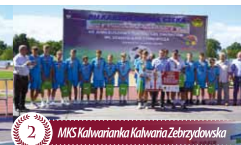
2 MKS Kalwarianka Kalwaria Zebrzydowska