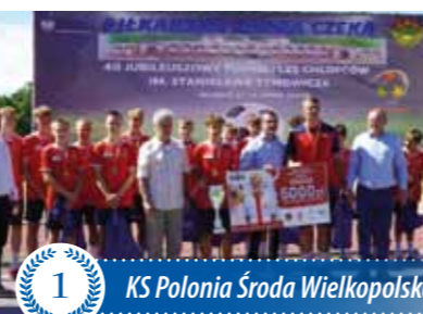
1 KS Polonia Środa Wielkopolska